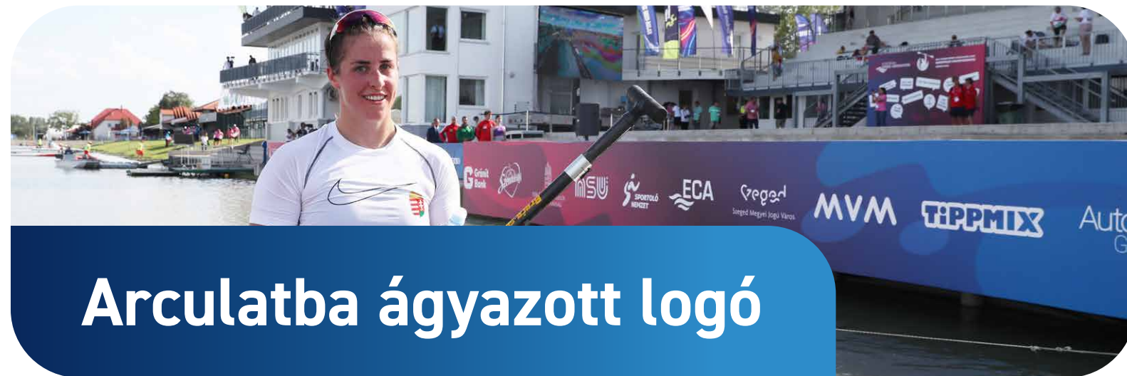
Arculatba ágyazott logó